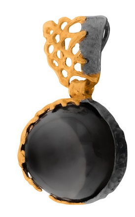
Подвеска с золотым покрытием $ 92,00