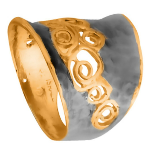
Кольцо с золотым покрытием $ 38,00