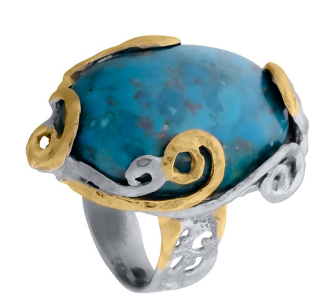
Кольцо с золотым покрытием $ 68,00