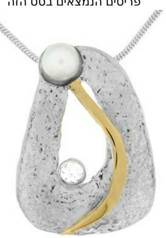
Silver and Gold Pendant 20.00$