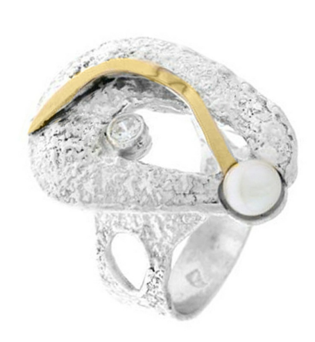
Silver and Gold Ring 27.83$