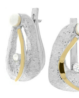
Silver and Gold Earrings 36.96$