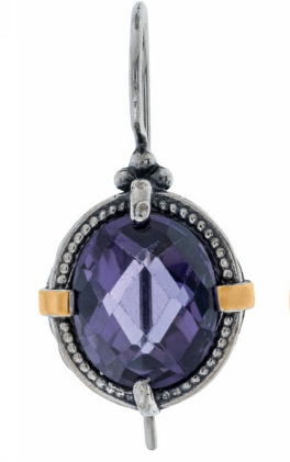
עגילי כסף בשילוב זהב 35.00$