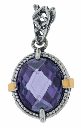
תליון כסף בשילוב זהב 17.00 $