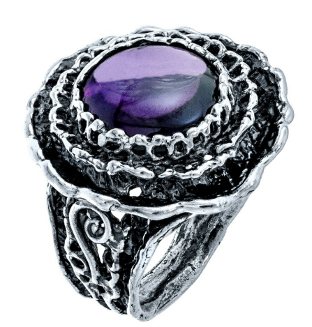
טבעת כסף 39.00$