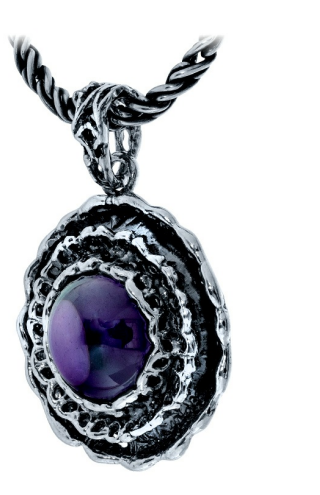
תליון כסף 23.00 $