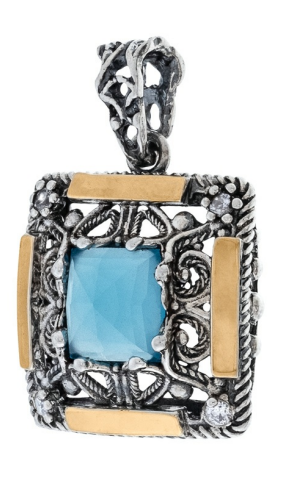
תליון כסף בשילוב זהב 25.00$