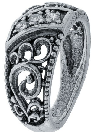
טבעת כסף 18.00$