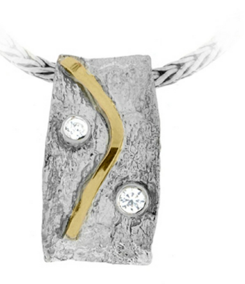
Silver and Gold Pendant 16.09 $