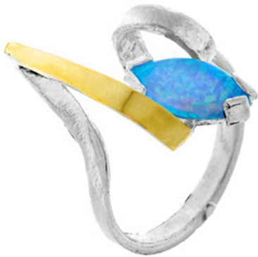
Drop of water $ 23,91