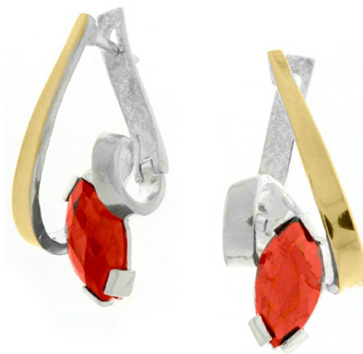
Silver and Gold Earrings $ 29,13