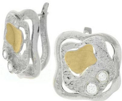
Silver and Gold Earrings $ 29,13