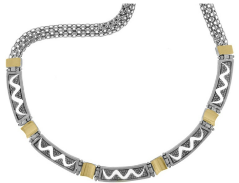
Silver and Gold Necklace $ 70,00