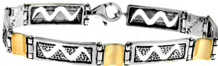
Silver and Gold Bracelet $ 52,17