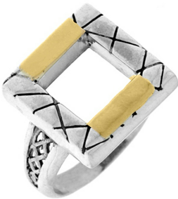
Open window $ 32,17