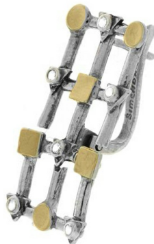
Silver and Gold Earrings $ 44,78