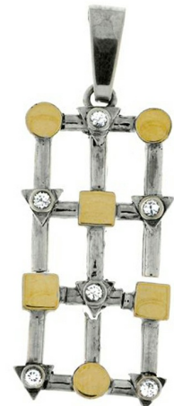
Silver and Gold Pendant $ 22,17