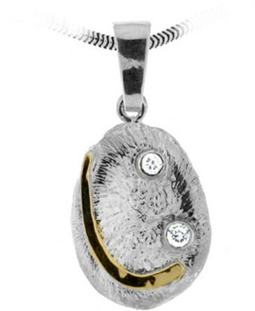
Silver and Gold Pendant $ 14,78