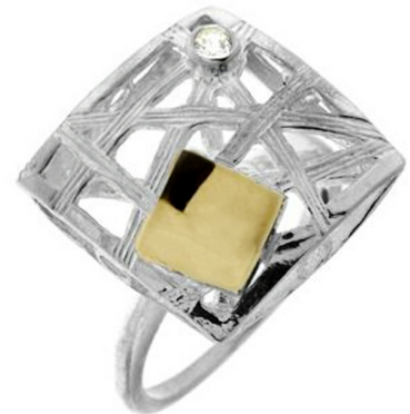
Серебряное кольцо с золотом $ 17,83