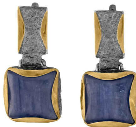
Серебряные серьги с золотым и платиновым покрытием $ 141,00