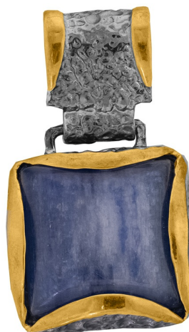
Подвеска с золотым покрытием $ 69,00