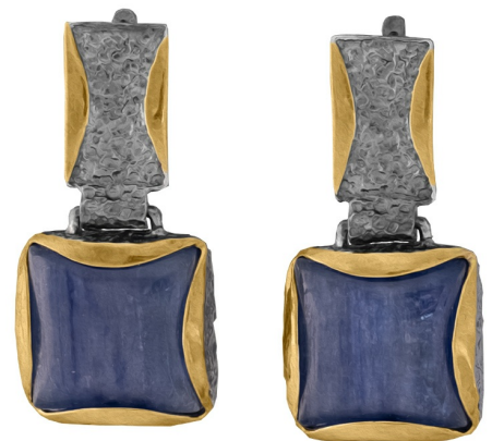
Серебряные серьги с золотым и платиновым покрытием $ 141,00