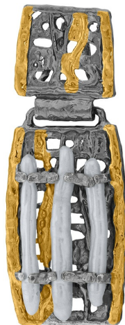
Подвеска с золотым покрытием $ 67,00