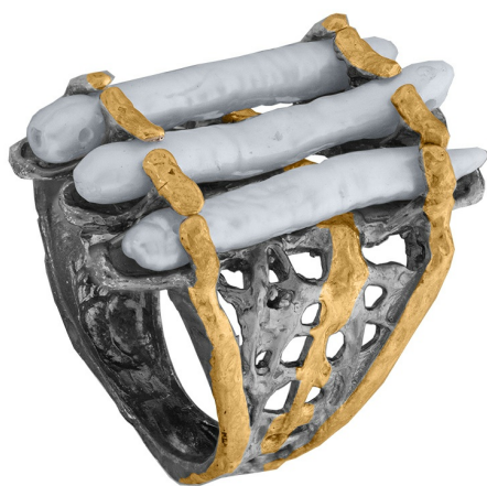
Кольцо с золотым покрытием $ 69,00