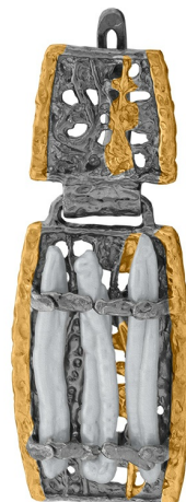
Серебряные серьги с золотым и платиновым покрытием $ 101,00