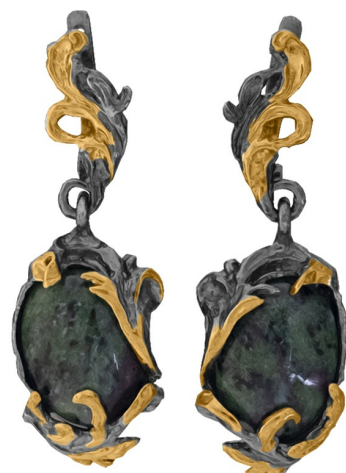
Серебряные серьги с золотым и платиновым покрытием $ 89,00