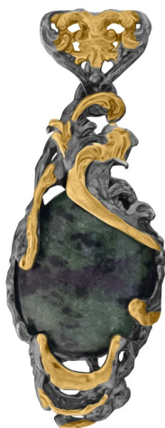
Подвеска с золотым покрытием $ 50,00