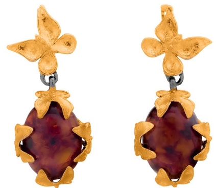
Серебряные серьги с золотым и платиновым покрытием $ 100,00