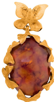
Подвеска с золотым покрытием $ 67,00