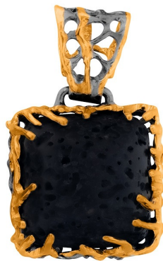
Подвеска с золотым покрытием $ 70,00