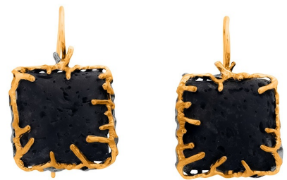
Серебряные серьги с золотым и платиновым покрытием $ 68,00