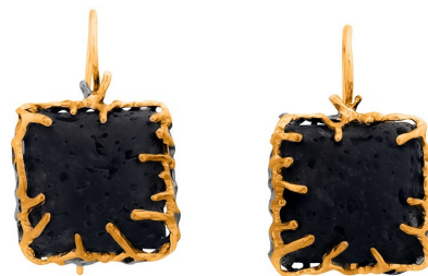
Серебряные серьги с золотым и платиновым покрытием $ 68,00