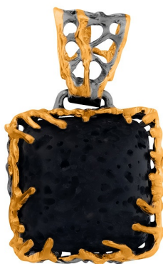
Подвеска с золотым покрытием $ 70,00