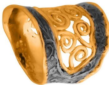
Кольцо с золотым покрытием $ 56,00