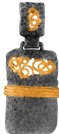
Подвеска с золотым покрытием $ 33,00