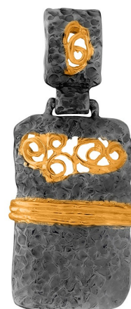
Подвеска с золотым покрытием $ 33,00