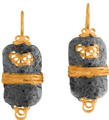
Золотые серьги с золотым покрытием $ 49,00