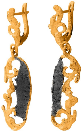
Золотые серьги с золотым покрытием $ 65,00