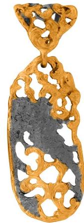
Подвеска с золотым покрытием $ 46,50