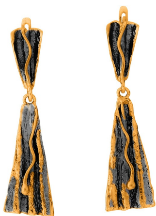
Золотые серьги с золотым покрытием $ 70,50