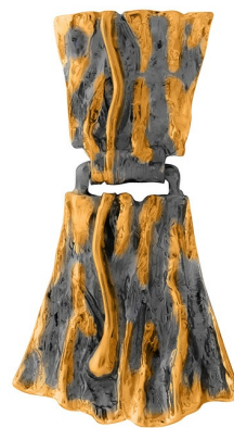
Подвеска с золотым покрытием $ 35,00