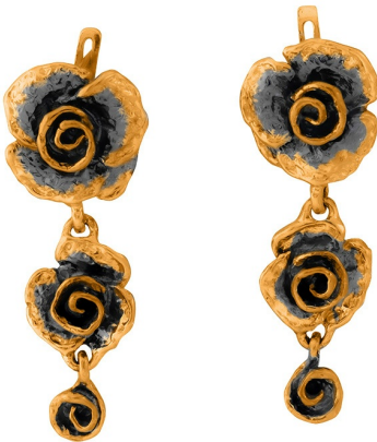
Золотые серьги с золотым покрытием $ 82,00