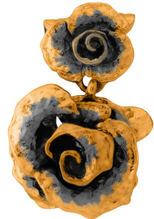
Подвеска с золотым покрытием $ 91,00