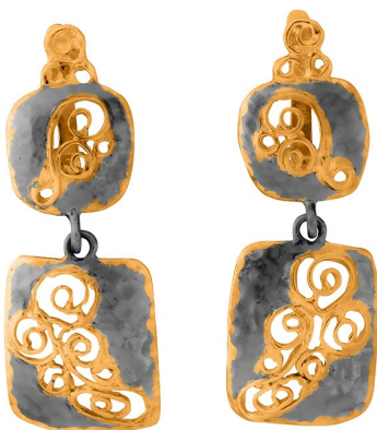
Золотые серьги с золотым покрытием $ 73,00