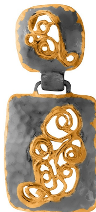
Подвеска с золотым покрытием $ 30,00