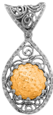
Silver and Gold Pendant $ 34,00