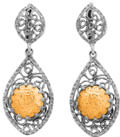
Silver and Gold Earrings $ 65,00