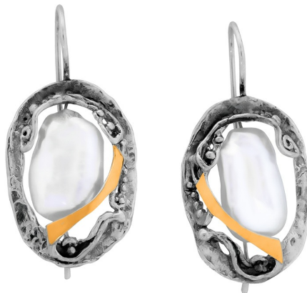
Серебряные серьги с золотом "Афродита" $ 39,00