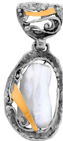
Серебряный кулон с золотом "Афродита" $ 30,00