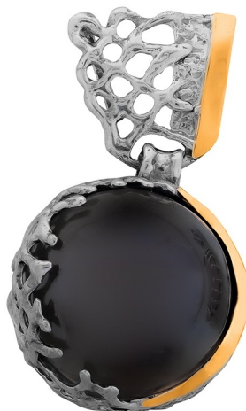
Silver and Gold Pendant $ 60,00