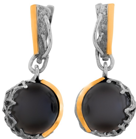
Silver and Gold Earrings $ 77,00