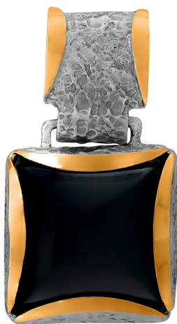
Silver and Gold Pendant $ 51,00