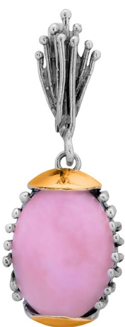
Silver and Gold Earrings $ 64,00