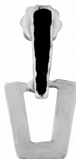
Серебряные Серьги с Эмалью $ 17,00