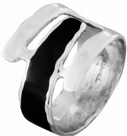
Серебряное Кольцо с Эмалью $ 22,00