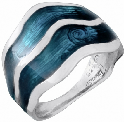
Серебряное Кольцо с Эмалью $ 22,00