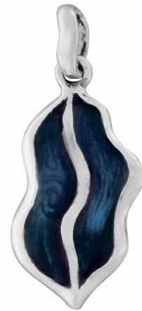
Серебряный Кулон с Эмалью $ 9,00