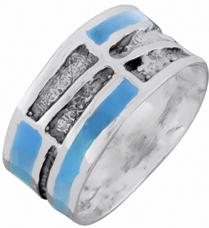
Серебряное Кольцо с Эмалью $ 19,50