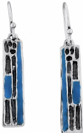
Серебряные Серьги с Эмалью $ 18,00