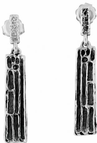
Серебряные серьги $ 14,00