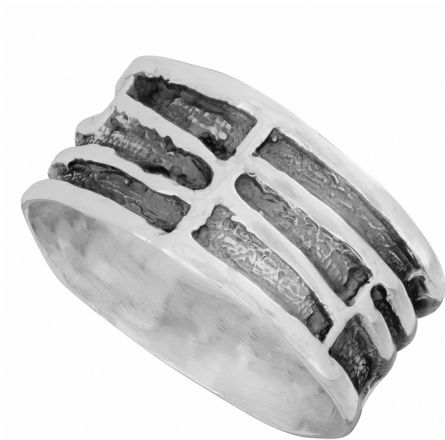
Серебряное кольцо $ 11,00