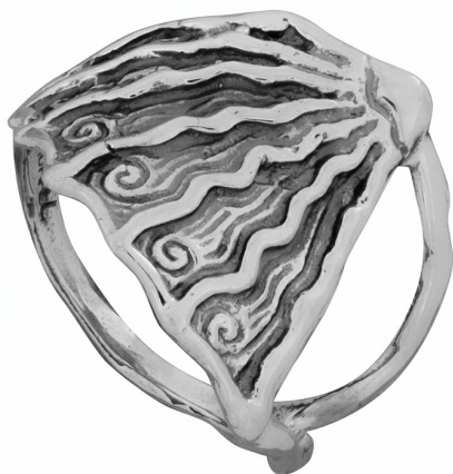
Серебряное кольцо $ 10,00