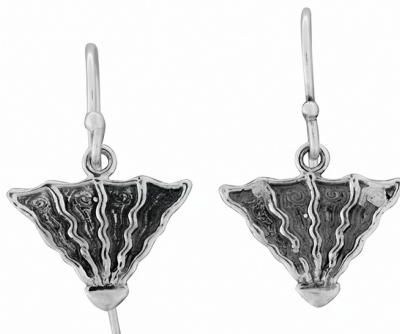
Серебряные серьги $ 9,00