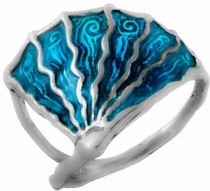
Серебряное Кольцо с Эмалью "Медуза" $ 16,50