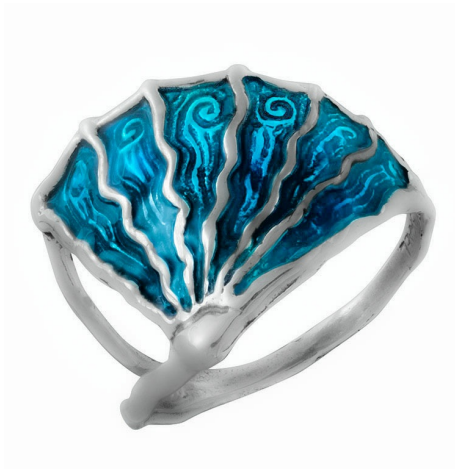
Серебряное Кольцо с Эмалью "Медуза" $ 16,50