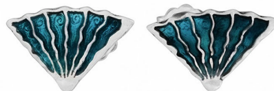
Серебряные Серьги с Эмалью "Медуза" $ 15,00