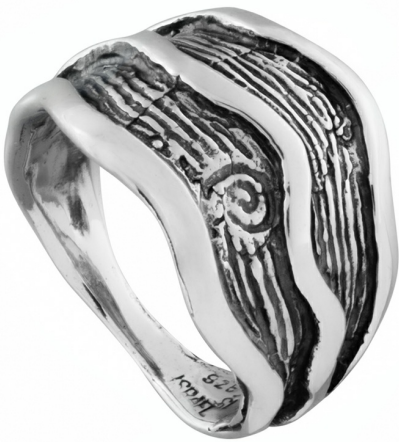
Серебряное кольцо $ 12,50