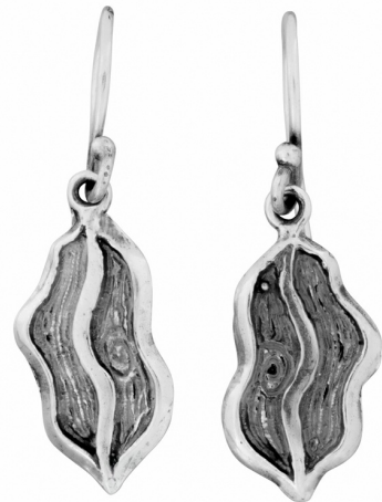
Серебряные серьги $ 11,00