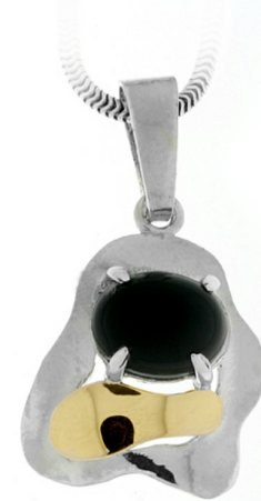
Silver and Gold Pendant $ 14,78