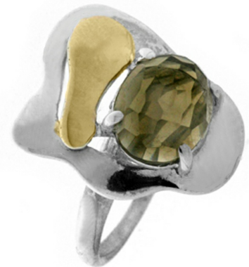
Серебряное кольцо с золотом $ 17,83