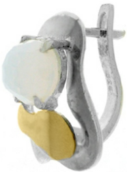
Silver and Gold Earrings $ 26,09