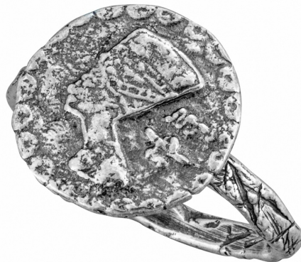
Серебряное кольцо $ 10,00