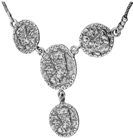
Silver Necklace $ 35,00