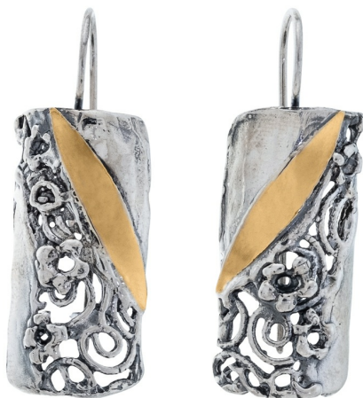
Серебряные серьги с золотом $ 38,00