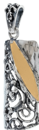
Серебряный кулон с золотом $ 18,00