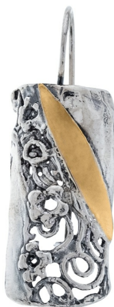
Серебряные серьги с золотом $ 38,00