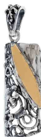
Серебряный кулон с золотом $ 18,00