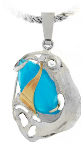
Silver and Gold Pendant $ 26,96