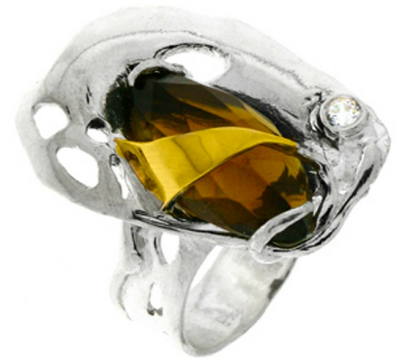
Серебряное кольцо с золотом $ 33,91