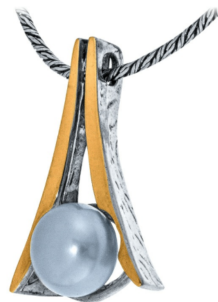
Серебряный кулон с золотом $ 19,50