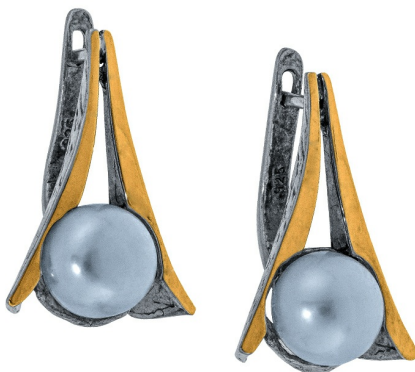
Серебряные серьги с золотом $ 46,00